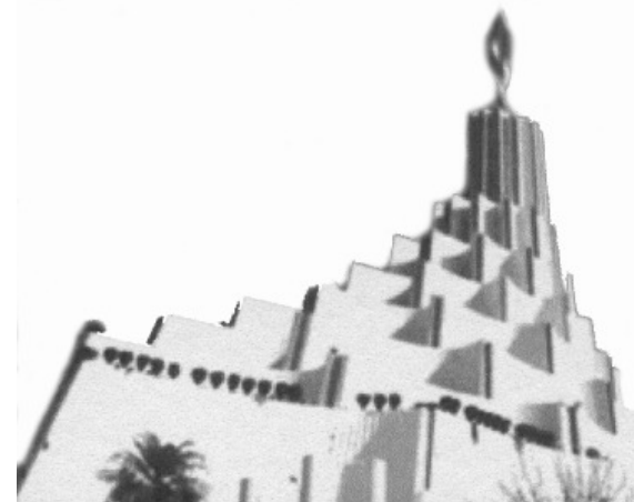
Templo Sede de "La Luz Del Mundo" en Guadalajara Jalisco, México

Porque se levantarán falsos Cristos, y falsos profetas, y harán grandes señales y prodigios, de tal manera que engañarán, si fuere posible, aun a los escogidos